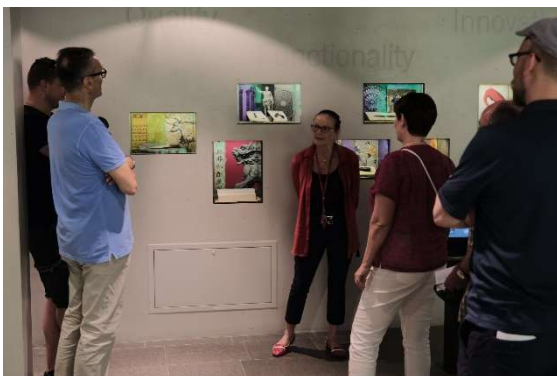
Vor den Vitrinen mit historischen Messern

Das und vieles Mehr kann man im Besucherzentrum der Victorinox in Brunnen kennen lernen. Eine Betriebsbesichtigung in Ibach ist leider nicht möglich, aber die Gruppe des EOP-Circles fühlte sich unter der fachkundigen Führung gut aufgehoben.