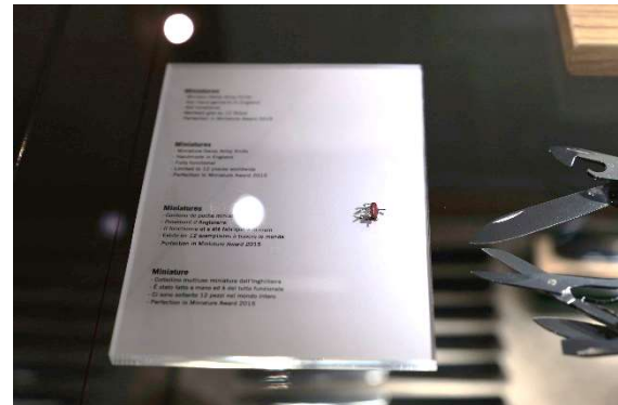
Aus England das kleinste Taschenmesser, welches funktionsfähig ist.

Aus der neuen Zeit werden hier alle Arten von Soldatenmesser, welche auch für ausländische Armeen gefertigt werden, sowie die aussergewöhnlichsten Messer gezeigt.