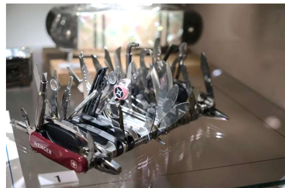
Mit 87 Werkzeugen und 141 unterschiedlichen Funktionen das multifunktionalste Taschenmesser der Welt.

Allerdings beiden Modellen würde ich eine gewisse Alltagstauglichkeit absprechen, bewundere aber die hohe handwerkliche Kunst.