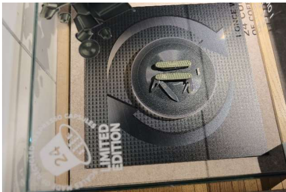
Nespresso-Kapseln werden zu Griffschalen

Die Bearbeitung der Messer braucht für das Schleifen, Schärfen und Reinigen viel Wasser. Dieses wird in einem geschlossenen Kreislauf immer wieder verwendet. Die Prozesswärme wird für Fernwärme weiterverwendet. Und einzelne Taschenmesser sind gar als Recycling-Produkt entworfen worden.