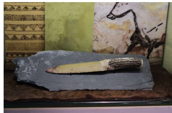
Schneide aus Stein und Horngriff

Die Erfindung des Messers ist in der menschlichen Entwicklung wohl eine grosse Kulturleistung. Es war eine Weiterentwicklung der Faustkeile. Denn es erlaubte die bessere Zubereitung von Wildbret und verbesserte damit die Ernährung.